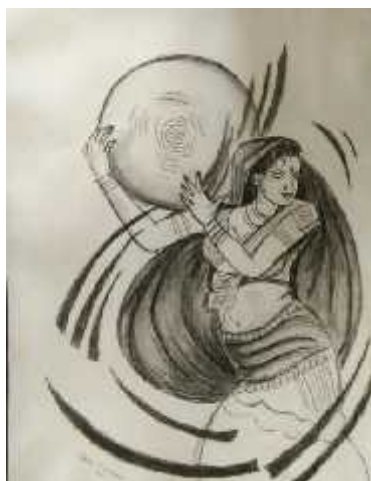
Title – Dancing Girl By Neha Chaudharv