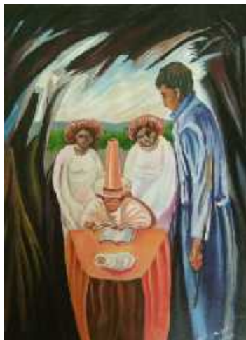
Title : Illusion By Neha Chaudharv