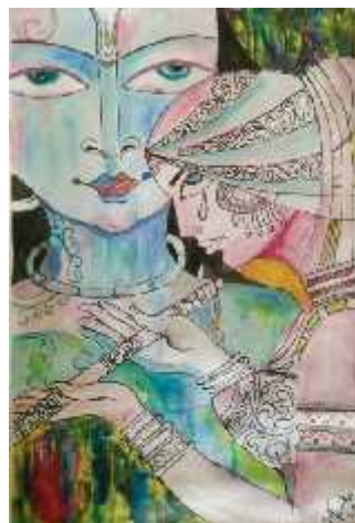
Title-Radha Krishan By Manika Guglani