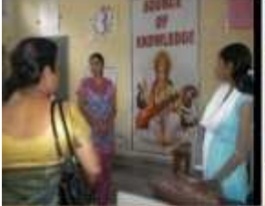
SOURCE OF KNOWLEDGE