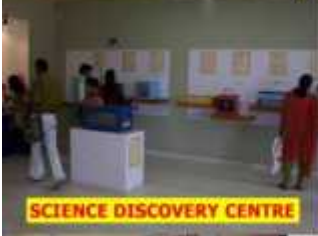
SCIENCE DISCOVERY CENTRE