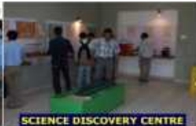
SCIENCE DISCOVERY CENTRE