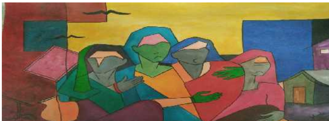
Title - Women Series By Manika Guglani