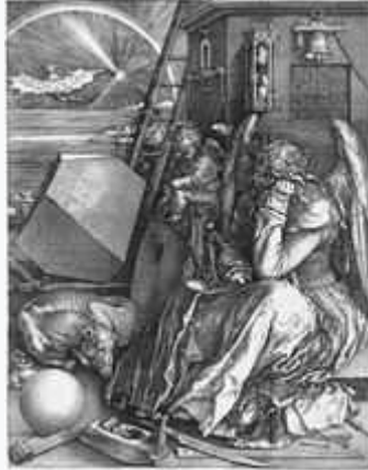
Albrecht Dürer: Melancholia I (1541)

and body itself. Printmaking is creating, for artistic purposes, an image on a matrix that is then transferred to a two-dimensional (flat) surface by means of ink (or another form of pigmentation). Except in the case of a monotype , the same matrix can be used to produce many examples of the print.