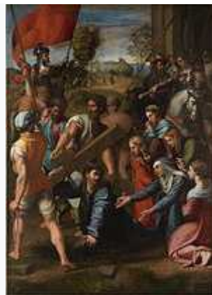
Raphael: Spasimo (1514-1516)

Painting taken literally is the practice of applying pigment suspended in a carrier (or medium ) and a binding agent (a glue ) to a surface (support) such as paper , canvas or a wall. However, when used in an artistic sense it means the use of this activity in combination with drawing , composition , or other aesthetic considerations in order to manifest the expressive and conceptual intention of the practitioner. Painting is also used to express spiritual motifs and ideas; sites of this kind of painting range from artwork depicting mythological figures on pottery to The Sistine Chapel to the human Like drawing, painting has its documented origins in caves and on rock faces. The finest examples, believed by some to be 32,000 years old, are in the Chauvet and Lascaux caves in southern France. In shades of red, brown, yellow and black, the paintings on the walls and ceilings are of bison, cattle, horses and deer.