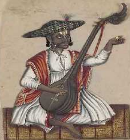
Shudra - Haridasa 12. 11. 1917

"A person's worth is determined by his knowledge and capacity and the inherent qualities which mark his conduct in life." The four fold division of castes' says the Creator in the Bhagavad Gita , "was created by me according to the apportionment of qualities and duties." "Not birth, not sacrament, not learning, make one dvija (twice-born), but righteous conduct alone causes it." "Be he a Sudra or a member of any other class, says the Lord in the same epic, "he that serves as a raft on a raftless current or helps to ford the unfordable, deserves respect everyway."